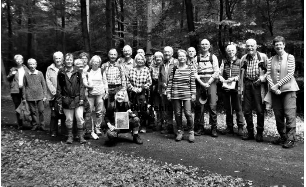
Friedeholz bei Syke, Sept. 21